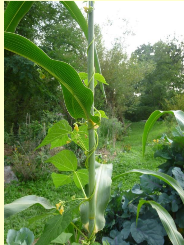
Bohnen ranken an Süßhirse