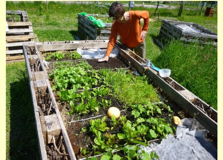
Säen und Pflanzen